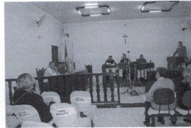
Confira na página 04