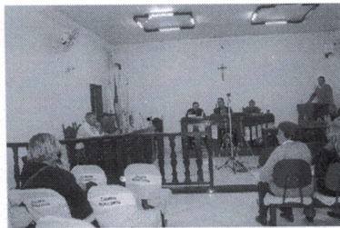
13ª Reunião Ordinária da Câmara Municipal de Baependi

de Lei nº 46/2019 de autoria do Executivo que "Dispõe sobre autorização ao Poder Executivo Municipal para a transposição de saldo orçamentário no orçamento fiscal do município de Baependi para o exercício de 2019". Ementa do Projeto de Lei nº 47/2019 de autoria do Executivo que "Autoriza abertura de crédito adicional complementar ao orçamento fiscal do município de Baependi para o exercício de 2019 no montante de R$ 7.212,03. Ementa do Projeto de Lei nº 48/2019 de autoria do Executivo que "Autoriza movimentação orçamentária por transferência de saldos de dotações do orçamento fiscal do município de Baependi para o exercício de 2019". Ementa do Projeto de Lei nº 51/2019 de autoria do Executivo que "Altera a Lei Municipal nº 2.721 de 23 de